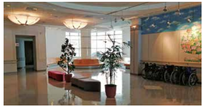
展示ホール・ロビー