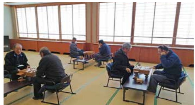
第1・第2教養娯楽室